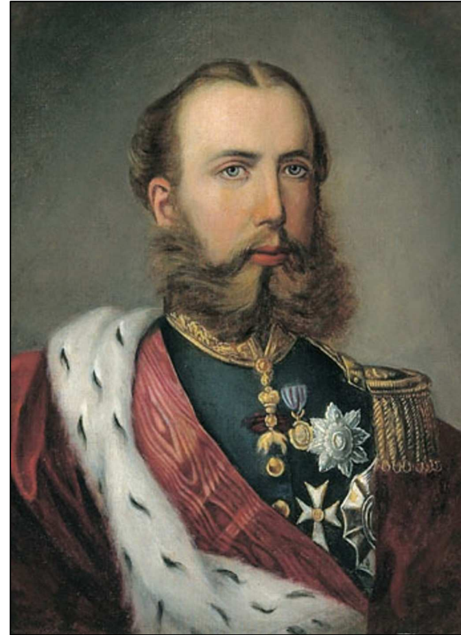
...és mint mexikói császár.

Miksa főparancsnokságának tíz esztendeje a haditengerészet történetének egyik legragyogóbb, legdinamikusabb fejlődő korszaka volt. Munkájának gyümölcsei még életében, de már Mexikóba távozása után érték be: az olasz flotta felett aratott 1866-os a lissai tengeri győzelmet és a haditengerészet nemzetközi elismerését – amire nagyon vágyott – még megérhette (igaz nem főparancsnokként), s ha nem vitte volna keresztül páncélos-programját, Ausztria történelme bizonyosan másként alakul.