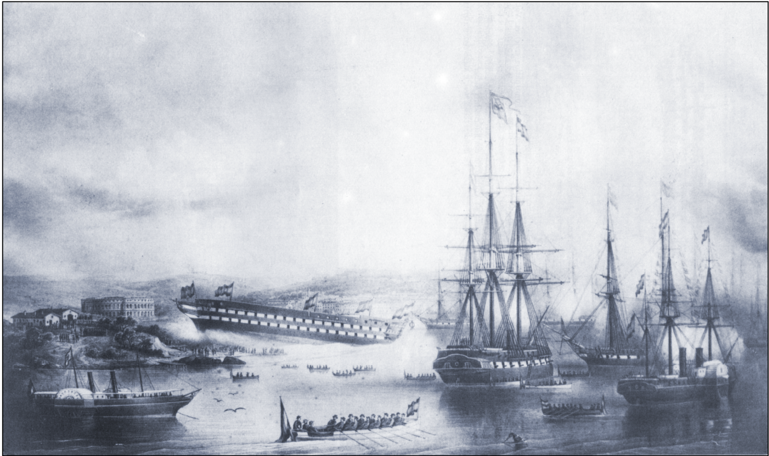
A brit AGAMEMNON mintájára tervezett KAISER csavargózós sorhajó vízretétele Polában 1858. október 4-én Ferdinánd Miksa jelenlétében.