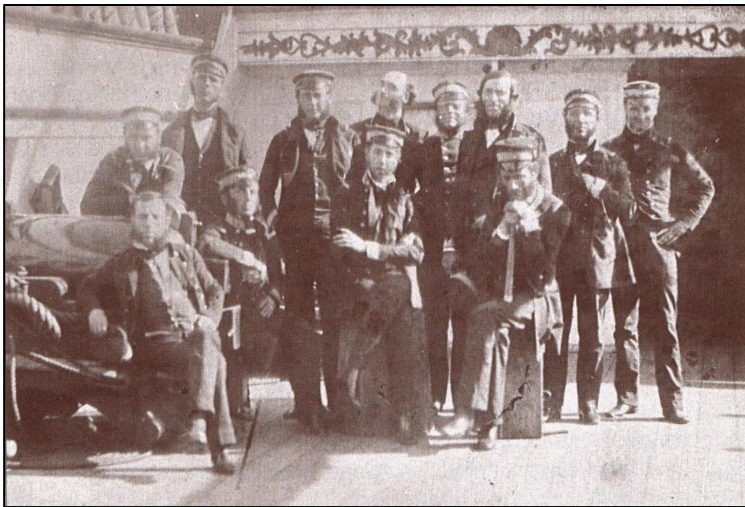
Az ifjú Ferdinánd Miksa (középen ül) még korvettkapitányként.

Az 1859-es vereség után politikai reformok kezdődtek Ausztriában. Az abszolútizmus rendszerét jelképező személyeket menesztették, az 1860. október 20-án ki-