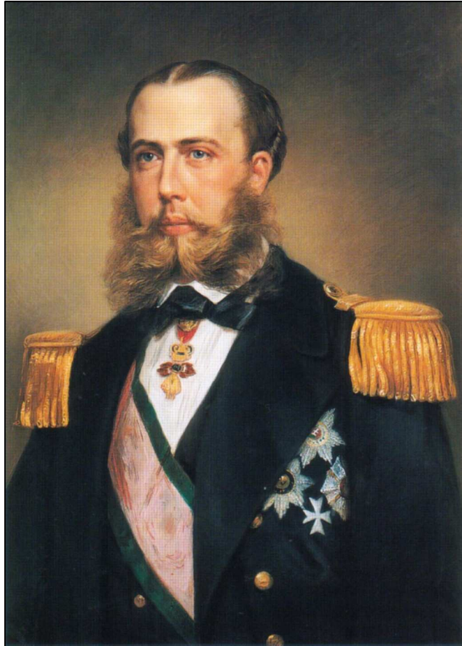
Ferdinánd Miksa, mint a tengerészet főparancsnoka...

A császár öccse, mint nagy költekező, nem volt túlságosan népszerű a birodalmi tanács szemében, ezért nem számíthatott újabb, felelős pozícióra. A Habsburg birodalmon belül minden lehetőség megszűnt Miksa számára, hogy ambícióinak és rangjának megfelelő hivatalt kapjon, ezért egy külföldi trón elfoglalása jelentette számára az egyetlen esélyt a vágyaihoz és méltóságához illő élethez.