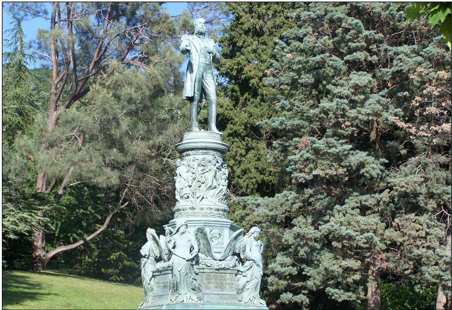
Ferdinánd Miksa eredetileg Triesztben a tengerparton felállított szobra ma Miksa egykori miramari kastélya kertjében.