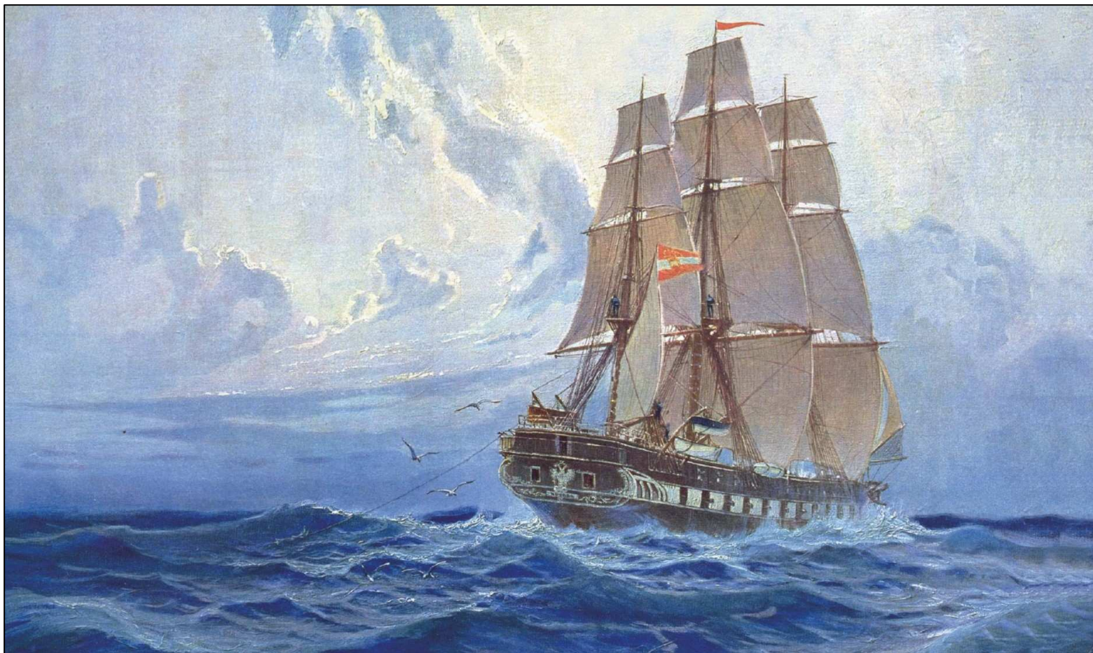
A NOVARA fregatt az Indiai-óceánon a Ferdinánd Miksa javaslatára szervezett földkörüli út során.