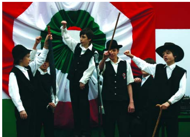
Az ünnepi műsort a Szent András Általános Iskola diákjai adták