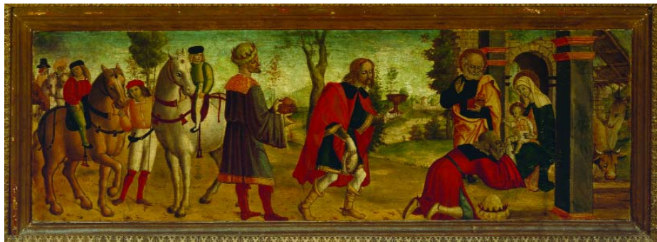
Antonio Marinoni: A három Királyok imádása, fatábla, 27 x 85 cm

teljes árú jegy: 2000 Ft kedvezményes diák és nyugdíjas jegy: 1000 Ft 6 évnél fiatalabbaknak, 70 éven felülieknek és érvényes pedagógus igazolvánnyal a belépés díjtalan. Szeretettel várunk minden érdeklődőt!