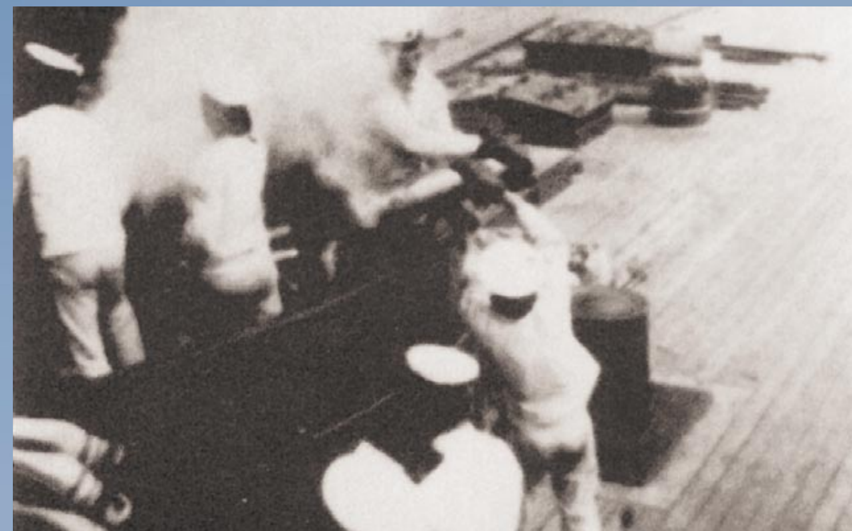
A FARLÓVEG MUNKÁBAN

A TIENCSINI OSZTRÁK-MAGYAR GYARMAT 1917-ES FENNÁLLÁSÁIG A KAISERIN ELISABETH 1913.08.19-ÉN FUTOTT KI UTOLJÁRA KÍNA FELÉ. A VILÁGHÁBORÚ KITÖRÉSEKOR IS OTT TARTÓZKODOTT, S 1914.08.26-ÁN BEFUTOTT A JAPÁNOK ÁLTAL FENYEGETETT CSINGTAU NÉMET GYARMAT KIKÖTŐJÉBE, AZZAL AZ UTASÍTÁSSAL, HOGY TÁMADÁS ESETÉN VEGYEN RÉSZT A VÉDELEMBEN. 1914.09.02-ÁN A JAPÁNOK MEGKEZDTÉK CSINGTAU OSTROMÁT. A KIRKÁLÓ NÉHÁNY LÖVEGÉT LESZERELTÉK ÉS A SZÁRAZFÖLDI TÜZÉRSÉG TÁMOGATÁSÁRA A SZEMÉLYZET 294 TAGJÁVAL EGYÜTT PARTRA TETTÉK. AZ OSTROM SORÁN AZ ELLENSÉG ERŐSEN LÖTTE A KIKÖTŐT, ÍGY A HAJÓ CSAK GYAKORI HELYVÁLTOZTATÁSSAL TUDTA ELKERÜLNI, HOGY TALÁLATOT KAPJON. A TÚLERŐ VÉGÜL LEGYÜRTE AZ ELLENÁLLÁST, ÉS CSINGTAO NOVEMBER 7-ÉN MEGADTA MAGÁT. A KAISERIN ELISABETH-ET A SAJÁT SZEMÉLYZETE MÁR KORÁBBAN, NOVEMBER 3-ÁN ELSÜLLYESZTETTE. A VÁROS VÉDELMÉBEN A CIRKÁLÓ LEGÉNY-SÉGÉBŐL 10 FŐ ESETT EL, A TÖBBIK JAPÁN HADIFOGSÁGBA KERÜLTEK, ÉS CSAK 1920-BAN JUTOTTAK HAZA.