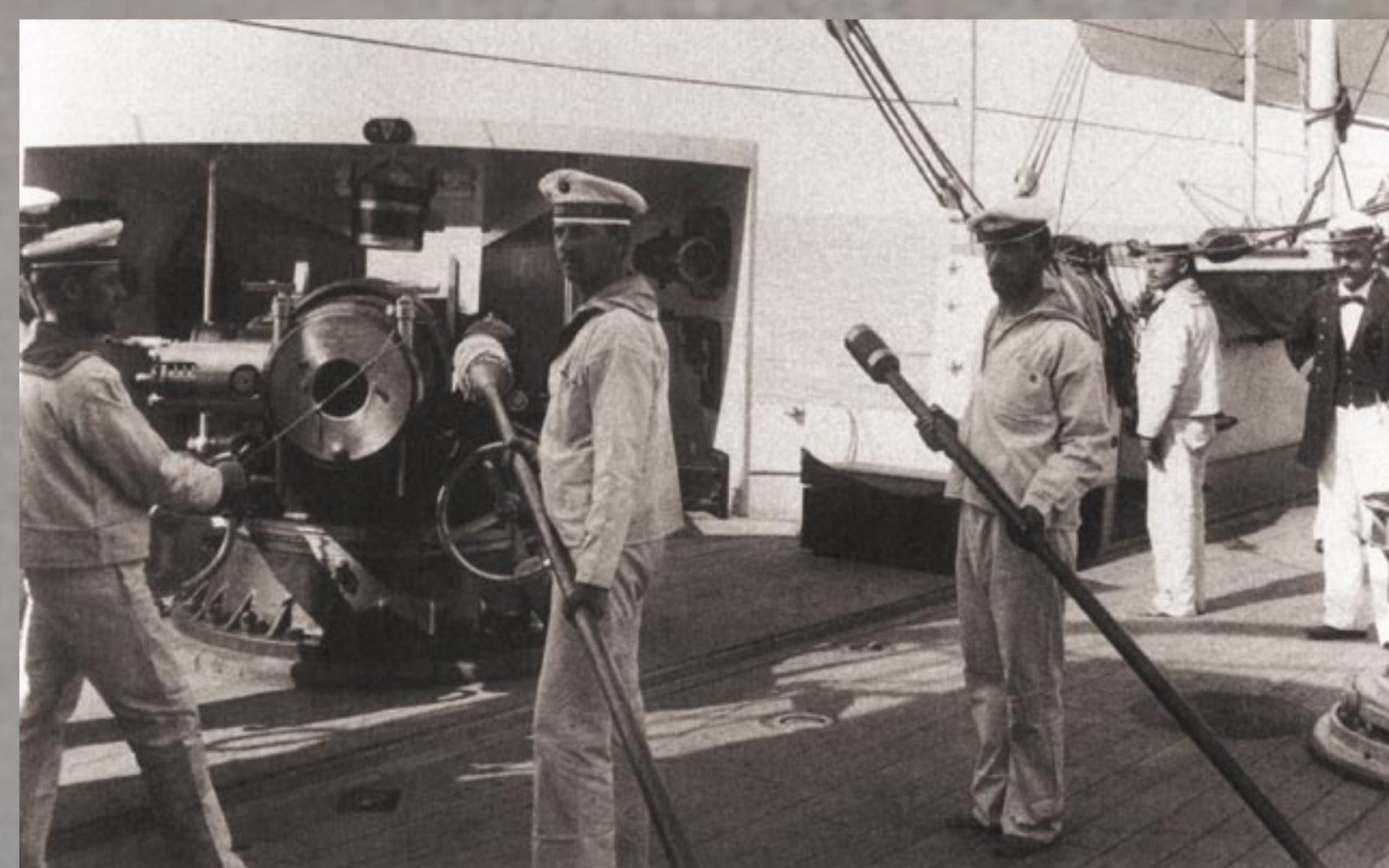
AZ ÖTÖSSZAMÚ LÖVEG SZEMÉLYZETE