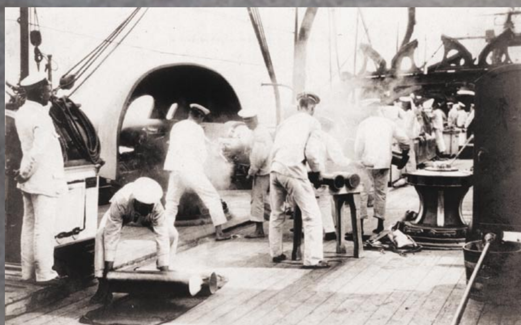
A KAISERIN ELISABETH TÜZÉRSÉGE MUNKÁBAN