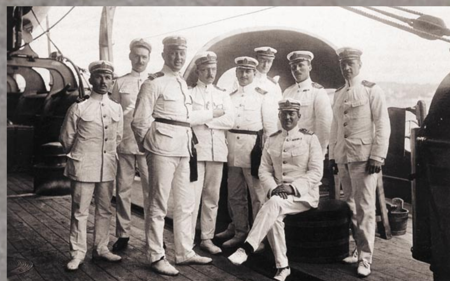
A CIRKÁLÓ TISZTJEI NYÁRI UNIFORMISBAN